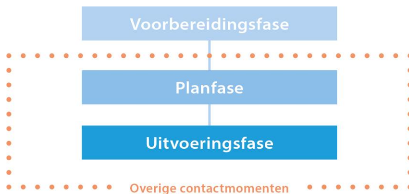
Figuur 2 – De fases van een interventie

Vanuit de geïncludeerde onderzoeken is een veelvoud aan (potentieel (niet-)werkzame) bestanddelen van ouderbetrokkenheid binnen interventies onttrokken. Een belangrijke constatering die uit het literatuuronderzoek naar voren komt is dat een interventiedewerker 8 een bestanddeel van ouderbetrokkenheid op verschillende manieren kan toepassen in een interventie. Dit blijkt in sterke mate afhankelijk van de fase van de interventie. We kaderen deze verschillende fases in een interventie als volgt in: de voorbereidingsfase, de planfase en de uitvoeringsfase. Deze drie fases volgen elkaar in chronologische volgorde op, terwijl de interventiedewerker de ouders ook kan betrekken tijdens verschillende contactmomenten buiten de interventiesessies. Deze contactmomenten lopen continu en door de plan- en uitvoeringsfase heen (zie Figuur 2). Hierna bespreken we de in de literatuur genoemde bestanddelen en eventuele operationalisaties per interventiefase. Het hoofdstuk besluit met een uiteenzetting van in het onderzoek naar voren gekomen interventiemateriaal.