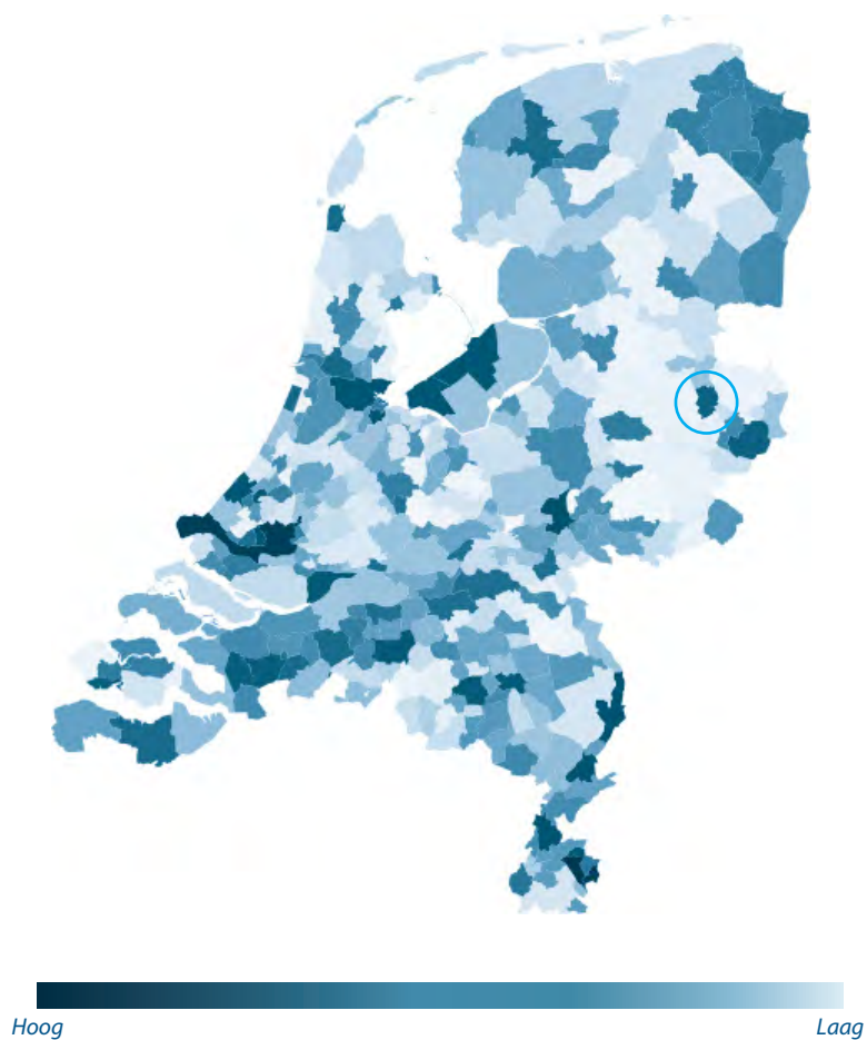
Figuur 1 – kwetsbaarheid van criminele ondermijning per gemeente en voor de gemeente Almelo 5

De Onderwereldkaart geeft over vijf van de twintig 4 indicatoren voor Almelo ook specifieke informatie. In figuur 1 is te zien welke kleur Almelo heeft met betrekking tot de kwetsbaarheid van ondermijning.