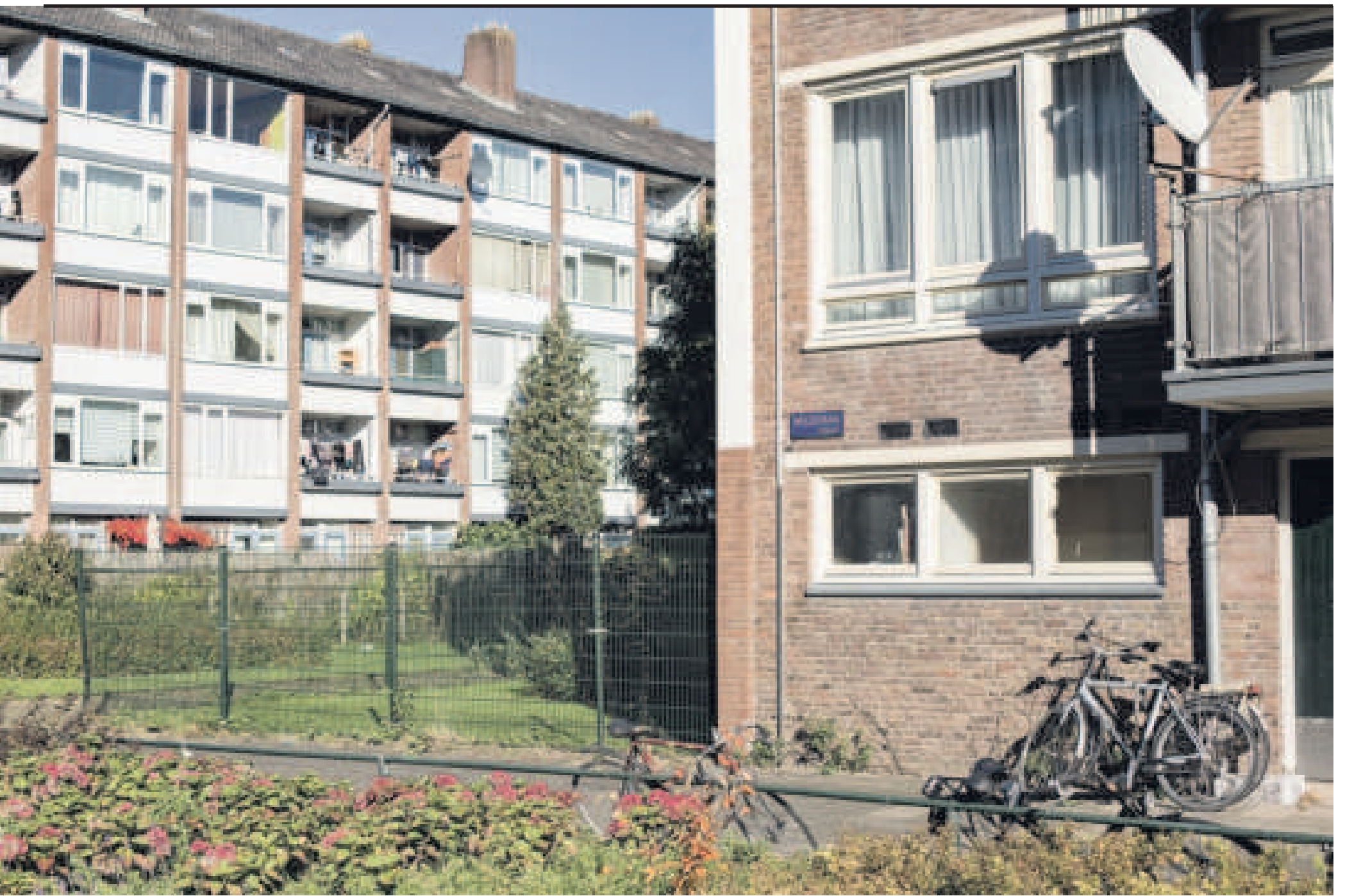
→ De huizen in de Wildemanbuurt verkeren vaak in slechte staat.

het moeilijk om via buitenstaanders tot de besloten kring door te dringen.